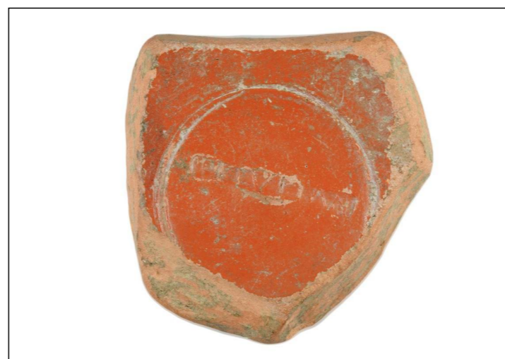
Fragmento de Terra Sigillata Hispánica co selo de Lupianus atopado no castro de Vigo.