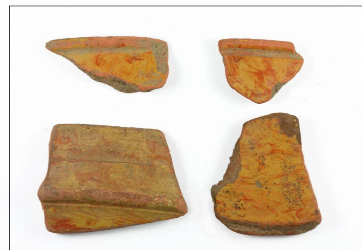
Fragmentos de cerámica marmorata procedentes do castro de Vigo.