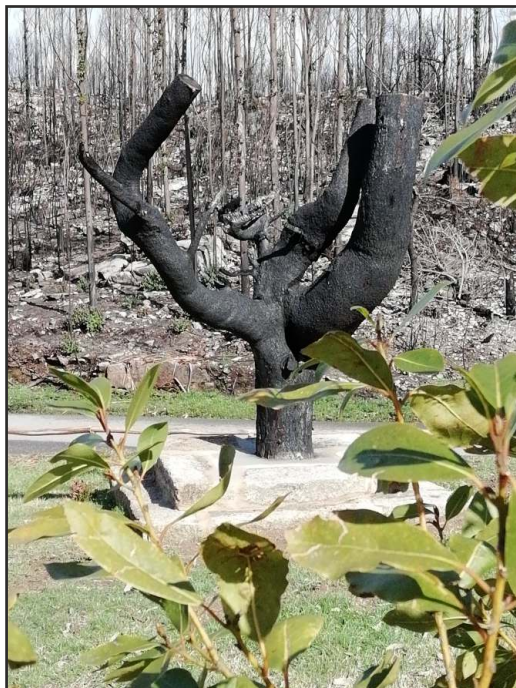
Árbore da Lembranza (Estrada do Zondal - Peimallo)

Mais ve que o meu corazón é unha rosa de cen follas i é cada folla unha pena que vive apegada noutra Quitás unha, quitás dúas : penas me quedan de sobra; hoxe dez, mañan corenta, desfolla que te desfolla... ¡ O corazón me arrincarás desque as arrincarás todas!