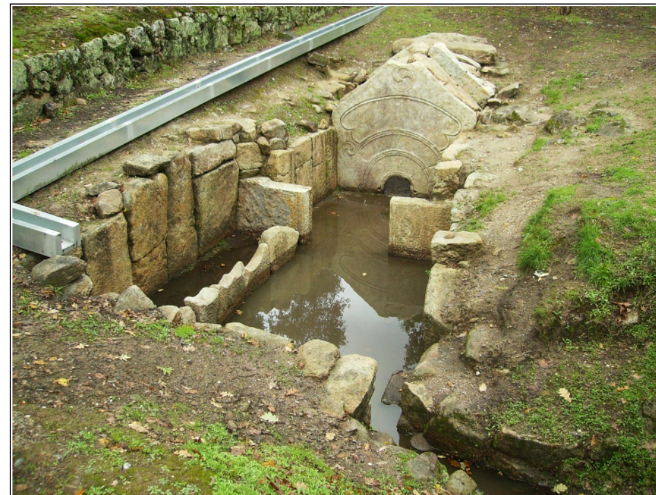
Sauna castrexa do castro de Briteiros.