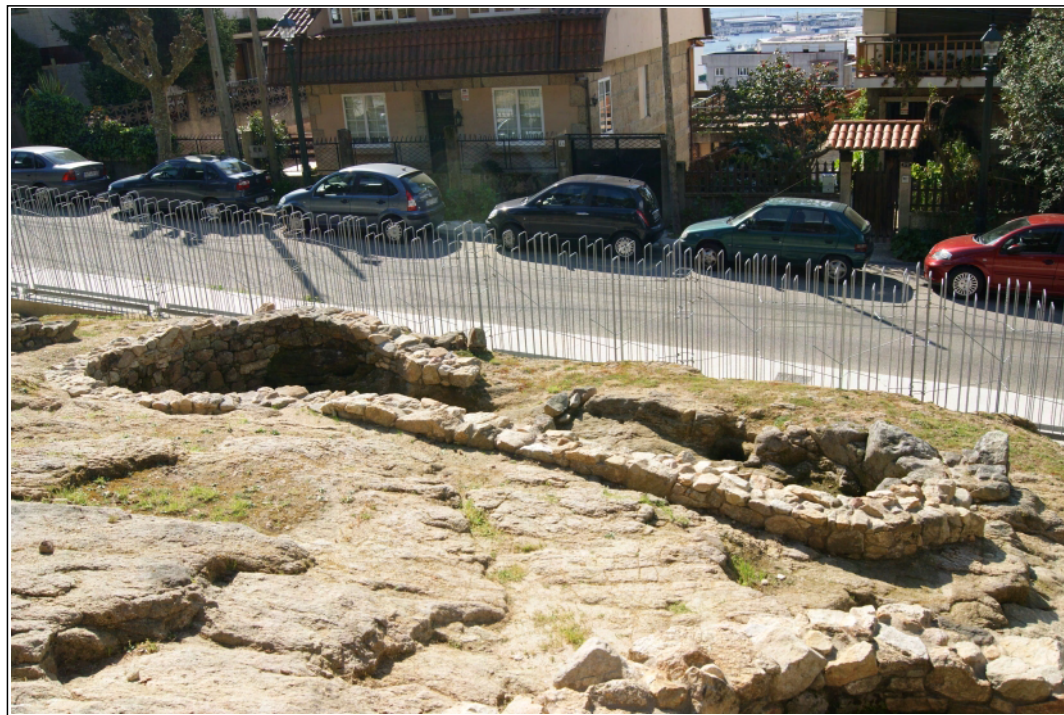
Sauna castrexa do castro de Vigo.