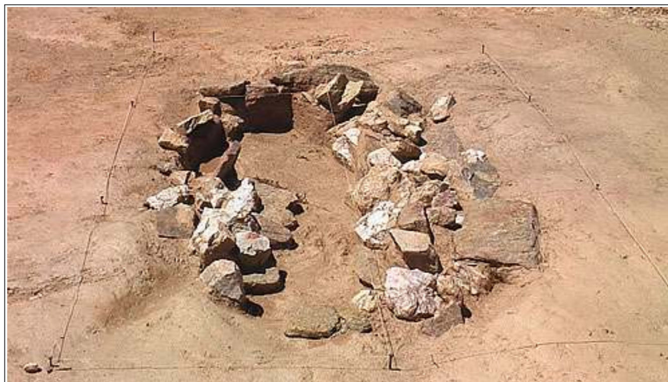
Posible enterramento castrexo atopado no castro de Castriño de Bendoiro, en Lalín.