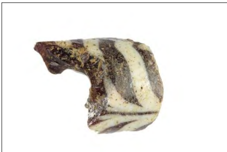
Doa de pasta vítrea de filiación púnica do Castro de Vigo.