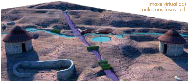
Imaxe virtual das canles nas fases I e II

O conxunto componse dunha canle inicial ancha e pouca profunda que corre en sentido da pendente do castro. A esta córtaa unha segunda canle transversal, máis estreita e profunda.