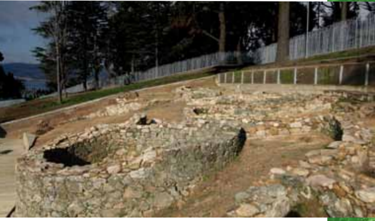
Imaxe xeral dos restos

Ante as réplicas, levantadas ata o tellado, os muros orixinais parecen pequenos e insignificantes. Con todo, son estes os que teñen auténtico sentido humano. Son os que construíron os seus habitantes, hai uns dous mil anos, para vivir coas súas familias. Por todo isto, e porque ofrecen información arqueolóxica, constitúen valiosos documentos do pasado que debemos coñecer e conservar.