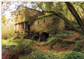
Muíño das Maquias Aos pés da Serra do Galiñeiro.

É un petroglifo cun extraordinario repertorio de armas: 12 puñais ou espadas curtas, 6 alabardas con mango... En total, 26 representacións realizadas na Idade do Bronce.