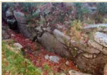
Muralla ciplopea Muro defensivo de 1.250 metros do século V.