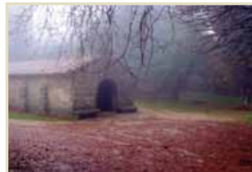
Ermida de San Xiao Capela románica reconstruída no 1713.